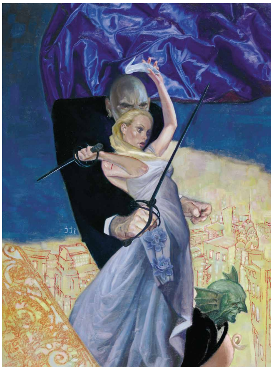
Ilustración para la portada de Fables núm. 2 USA (2002). Óleo y técnica mixta sobre panel de madera.

DIENOS Y FÁBULAS HISTORIA DE VERTIGO | 276