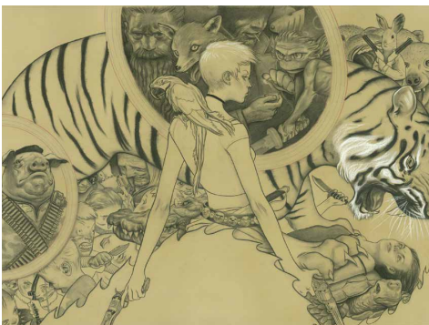
En la mitad superior, diseños preliminares a lápiz de ilustración para la portada de Fables vol. 2: Animal Farm USA (2004). En la mitad inferior, dibujo a carbón y tiza blanca de ilustración para la portada de Fables vol. 2: Animal Farm USA (2004). En la doble página siguiente, versión final, realizada con carbón, tiza blanca, acuarela y color digital.