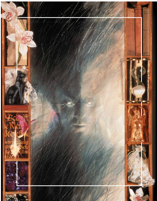
Ilustración de Dave McKean para la portada de The Sandman núm. 1 USA (1988)

103 | TERCERA PARTE: CÍRCULO DE CRECIMIENTO